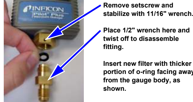
Figure 1. Pilot Plus Fitting

The Pilot Plus is equipped with a special filter to protect the vacuum sensor from oil and other contaminants. To change the filter, remove the setscrew in the unit's fitting. See Figure 1. Use an 1/16" wrench to stabilize the top portion of the fitting. Then twist off the lower portion of the fitting using a 1/2" wrench. Use needle-nose pliers or a similar item to gently pull out the used filter. Do not attempt to clean or re-use filters. Insert a new filter with the thicker portion of the o-ring facing away from the gauge's body. Re-attach the refrigerant flare. Tighten the fitting with the wrenches and replace the set screw to ensure vacuum integrity.